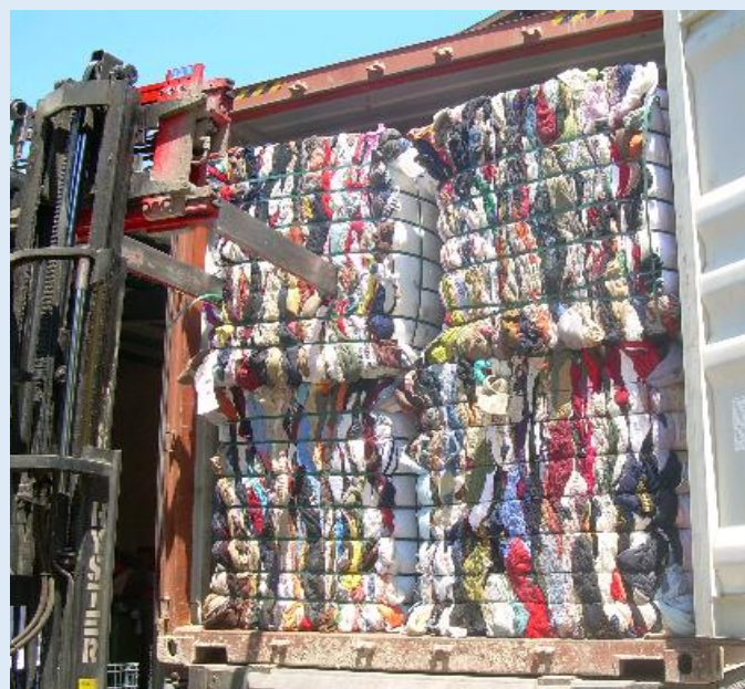
Càrrega d'un camió amb roba reciclable, destinat a l'exportació

Creiem que aquesta transparència animarà als usuaris dels contenidors a participar amb Roba Amiga en aquest procés de transformació d'un residu en un recurs, que tant suport dona al treball social a les nostres comarques.