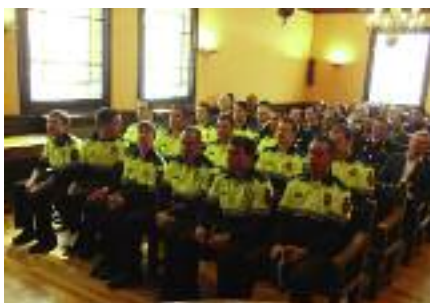
Instauració de la Diada de la Policia Local.

Programa de control i prevenció durant totes les festes nocturnes al Pavelló Firal (2009-2010-2011).