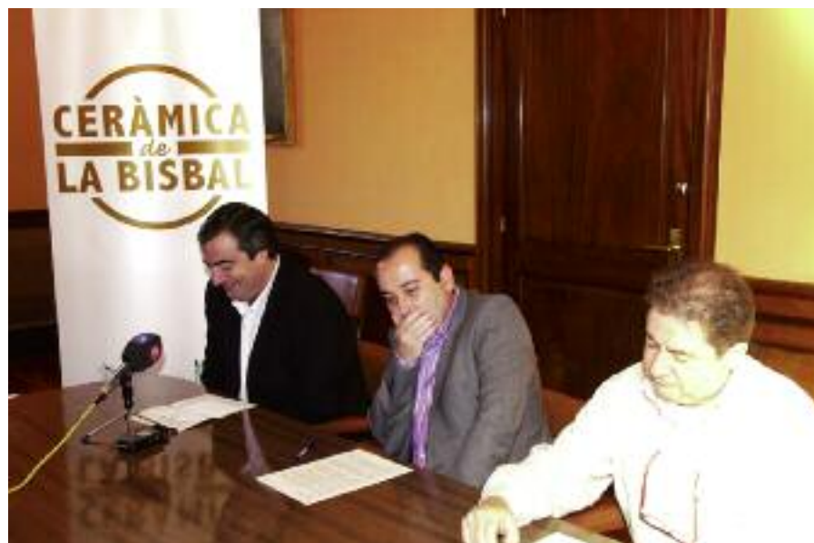
Creació, promoció i difusió de la marca de garantia Ceràmica de la Bisbal. Anys 2009 - 2010 - 2011.