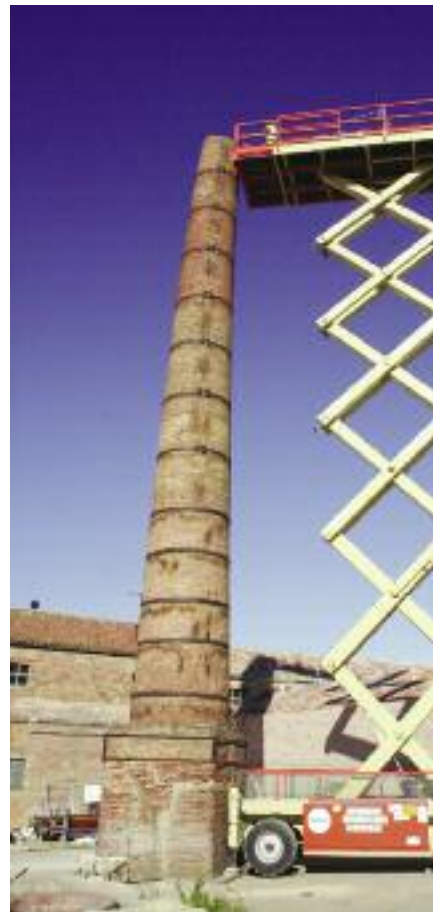
Rehabilitació de les xemeneies de Terracotta Museu.

Creació de passos elevats i eliminació de bandes reductores de velocitat: av. President Irla, Jaume II, Mas Clarà i Coll i Vehí.