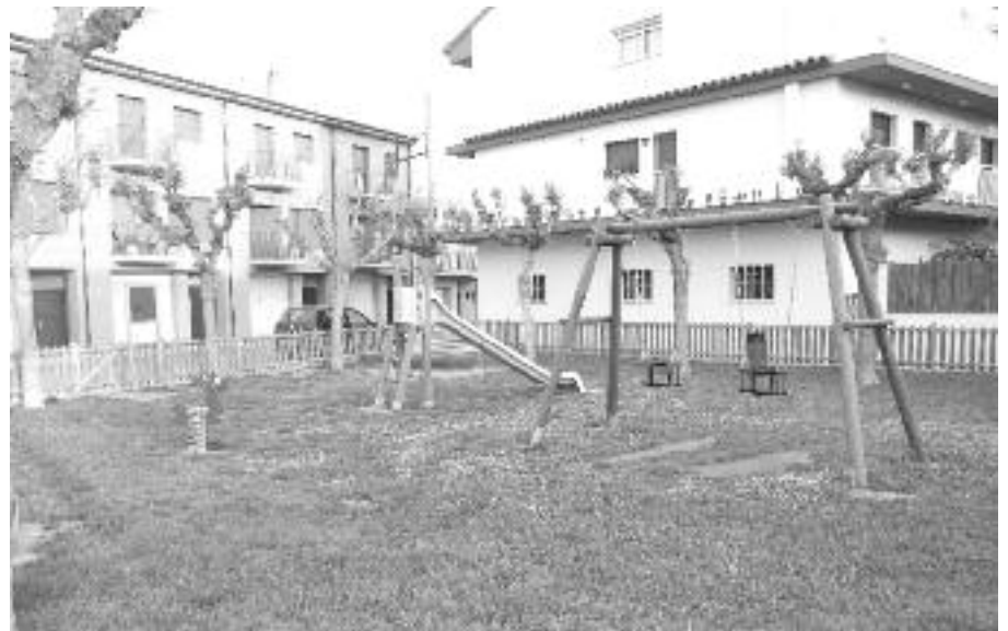
Els elements del parc infantil del carrer de Pere Torroella.

Després dels treballs d'enquitrant de l'aparcament de l'antiga Sata, fets el passat estiu, i de la construcció de la