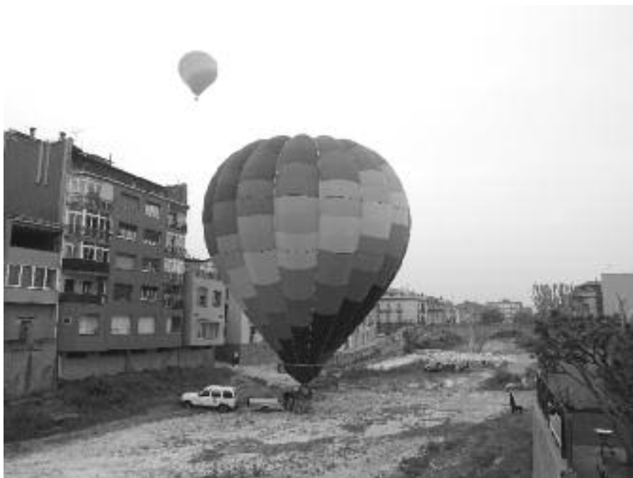
Els dos globus aerostàtics que es van enlairar de la llera del Daró.

Les passejades amb poni, inicialment previstes a la llera del Daró, es van traslladar al passeig Marimon Asprer, al costat de les atraccions de fira.