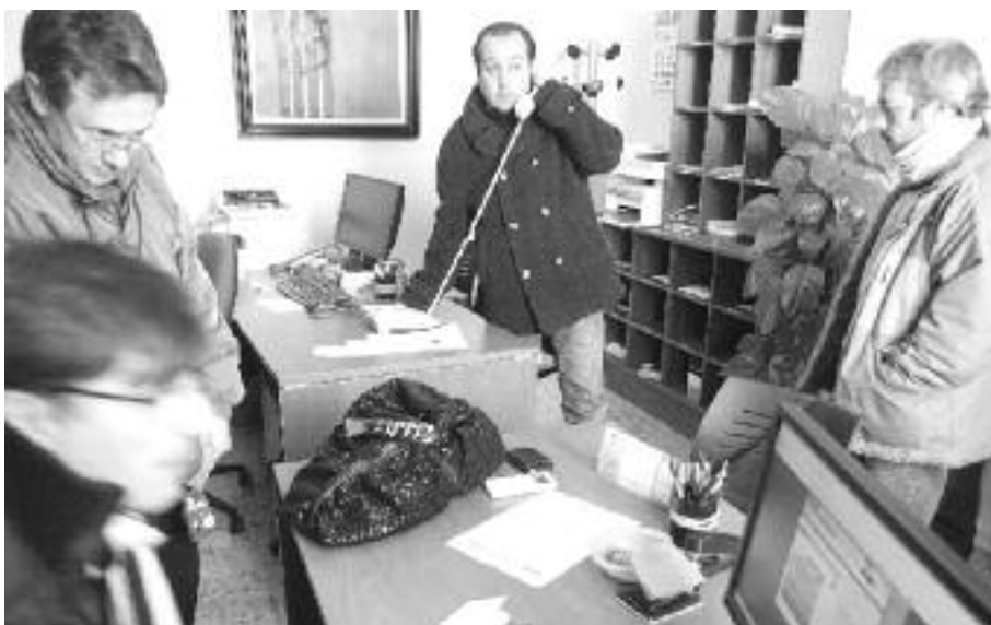
El dimecres 10 de març es van coordinar les feines per restablir els serveis des d'aquest despatx on hi havia un telèfon i un ordinador alimentats per un grup d'emergència.

El servei es va començar a restablir a par-