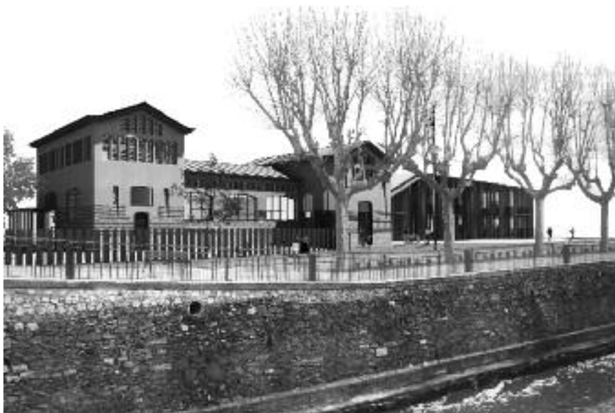
Fotomuntatge de la futura Biblioteca Central Comarcal.

El projecte del Casal Cívic l'executarà el Departament de Governació després que l'Ajuntament de la Bisbal li cedís l'any 2009 el solar ubicat darrere l'antic escorxador (seu de la futura Biblioteca Central Comarcal) per a la construcció de l'equipament. Una vegada seleccionat el guanyador del projecte, durant aquest any se'n farà la redacció i previsiblement