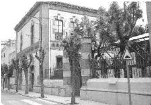
La nova escola se situarà de forma provisional a les Escoles Velles.

Provisionalment, s'ubicarà als baixos de les Escoles Velles però, de cara al curs