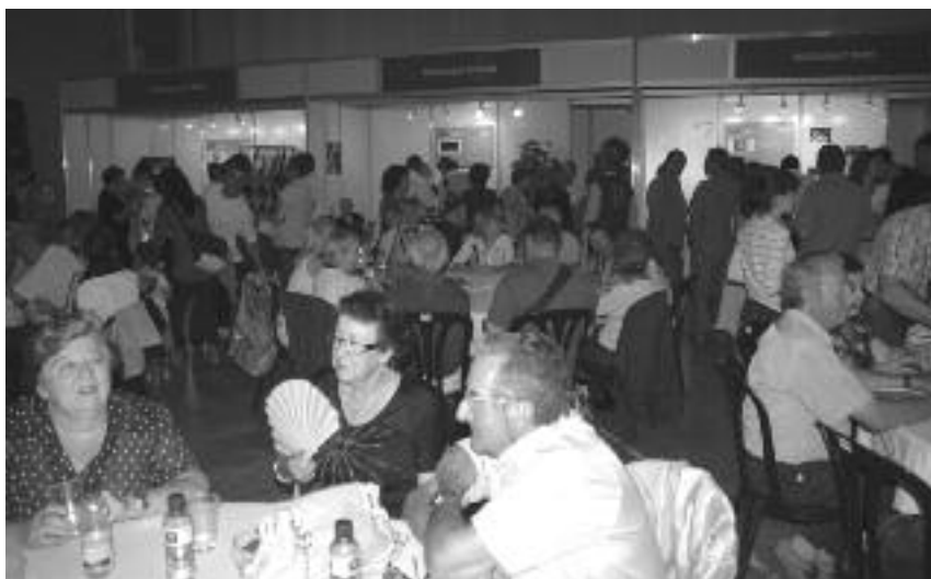
La fira va ser un èxit de públic durant tot el dia, tot i ser la primera edició.

Les activitats relacionades amb el món del vi que es van anar desenvolupant durant el dia al Pavelló Firal també van ser un èxit de públic, segons que ha informat l'organització de la mostra. Igualment, els expositors de ceràmica es van mostrar satisfets per com es va desenvolupar i per