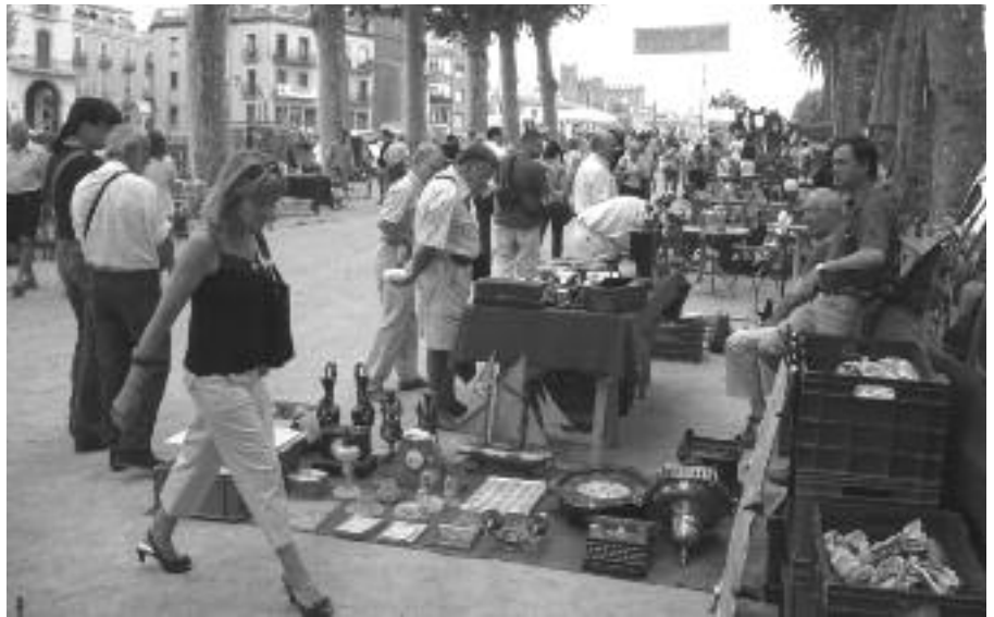
La fira de Brocanterers es va fer al passeig Marimon Aspser.

Es va celebrar coincidint amb la Diada de Catalunya