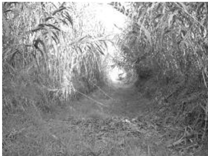
El desbrossament fet amb l'"efecte túnel".

S'han retirat les restes vegetals de la llera i fora del rec s'han triturat emprant una biotrituradora forestal.