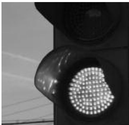
Un semàfor amb tecnologia LED de l'avinguda de l'Aigüeta.