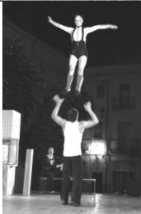
Dues de les actuacions que es van poder veure durant l'edició d'aquest 2009.

L'any que ve... Quinze anys... La plaça del poble. El poble a la plaça. La gent al carrer i el carrer de la gent. Espectacular: