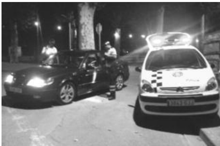
Dos policies locals duent a terme un control nocturn a la Bisbal.

La Policia Local els fa a les nits a les urbanitzacions, als polígons industrials i al nucli antic per millorar la seguretat