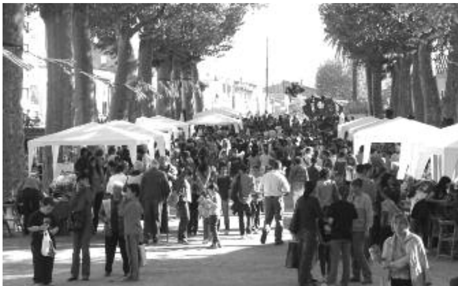
Aspecte del passeig Marimon Asprer la diada de Sant Jordi.

A les Escoles Velles, Joventut va organitzar