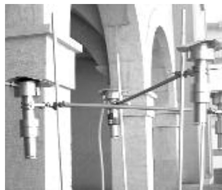
Els mesuradors de partícules, a l'Ajuntament.

La Bisbal participa en un estudi europeu per avaluar l'exposició a la contaminació atmosfèrica en col·laboració amb el centre de recerca en epidemiologia ambiental de Barcelona (CREAL-IMIM).