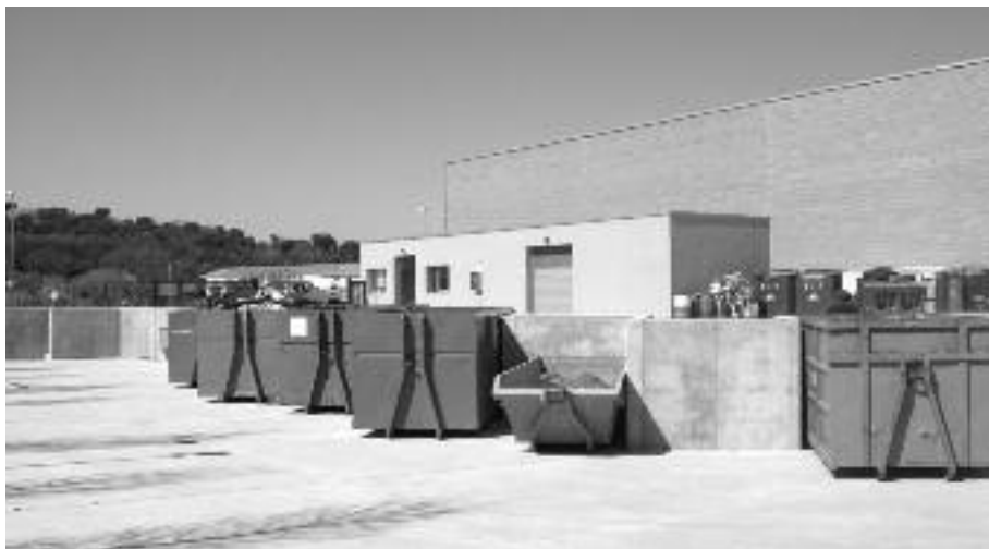
Les instal·lacions de la nova deixalleria, situada al camí vell de Corçà.

reutilitzar residus domèstics, especials o voluminosos. "Convido tots els bisbalencs a utilitzar la deixalleria", ha dit Àngel Planas. Per a les persones particulars, comerços,