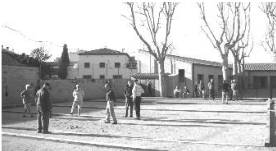
Les noves pistes de petanca s'han fet en un espai del camp de futbol vell.

L'any 2000 es va començar la Lliga de l'amistat amb els municipis de Celrà, Corçà, Torroella de Montgrí, Jafre. Al cap de dos anys s'hi van afegir Porqueres i Anglès. Aquest any es juga la X Lliga i hi participen Avinyonet, Porqueres, Corçà, Celrà, Riudellots, Santa Cristina, Torroella, Jafre, la Bisbal i Quart.