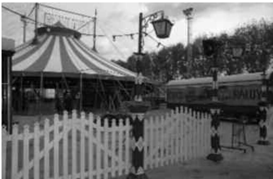
La carpa del Circ Raluy i un dels carretons restaurats, al camp de futbol vell.

L'Ajuntament aquest any ja ha facilitat la instal·lació del circ de petit format Nicole & Martin al mig del passeig Marimon Aspser i ara ha acollit el Circ Raluy al camp de futbol vell, en el què serà a partir d'ara l'espai d'acollida de circs de vela itinerants al municipi sempre que sigui possible. Aquestes iniciatives responen a la voluntat de l'Ajuntament de programar activitats de circ per tal de materialitzar el seu compromís en la difusió i el suport al circ de qualitat. El projecte Ciutats Amigues del Circ pretén crear un circuit estable de circ a Catalunya, atreure nous públics i