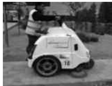
La màquina per netejar voreres.

L'entrada en funcionament d'una màquina petita serà una millora important per la neteja de voreres, segons l'Àrea de Via Pública. Disposa d'aspirador per retirar les brutícies dels animals i pot passar per carrers estrets i per les voreres porxadades o d'accés complicat. També es va fer una prova de neteja amb aigua a pressió a les Voltes, amb uns bons resultats, el 24 de setembre. En dies posteriors es va continuar a la resta del centre de la ciutat. Aquesta actuació és previst que continuï a les resta de zones comercials de la ciutat. La voluntat