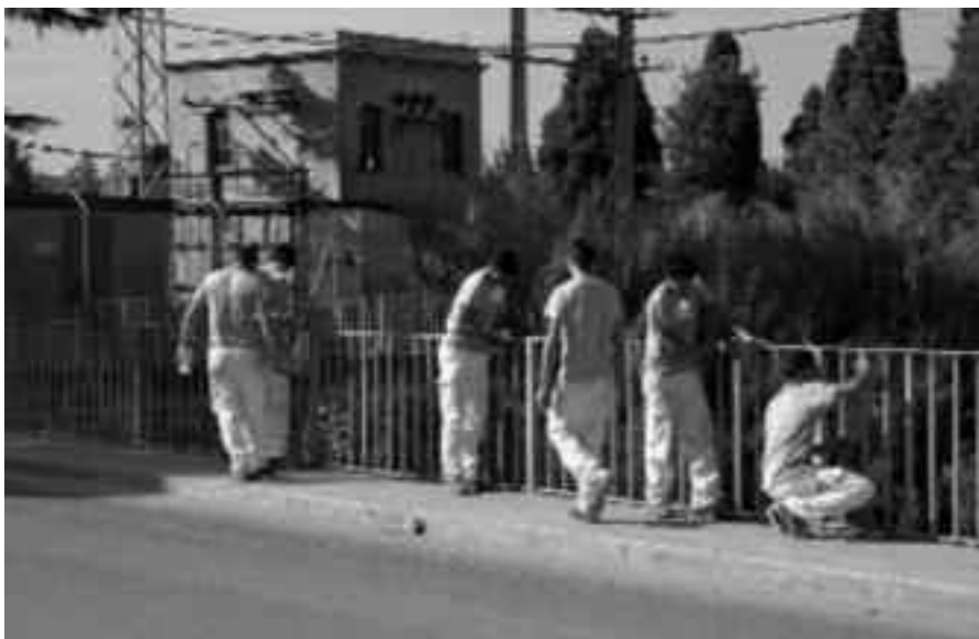
Els alumnes de l'ofici de pintura de l'Escola Taller de les Gavarres, en plena feina

En la primera fase d'execució de l'ofici de pintura de l'Escola Taller les Gavarres 2008-2010 les pràctiques formatives previstes són la rehabilitació i acondicionament de l'antic Parc de Bombers de la Bisbal d'Empordà com a seu de l'ofici de pintura i via pública de l'Escola Taller les Gavarres. També la rehabilitació i pintura de les baranes del Pont de l'Embut, de les parets i portals del camp de futbol vell per tal de condicionar-lo com un espai d'aparcament, el pintat de les baranes del Pont del rec Madral, el sanejament i pintura d'elements municipals de la via pública (balustres, papereres, jardineres) i el sanejament i pintura d'edificis públics municipals.