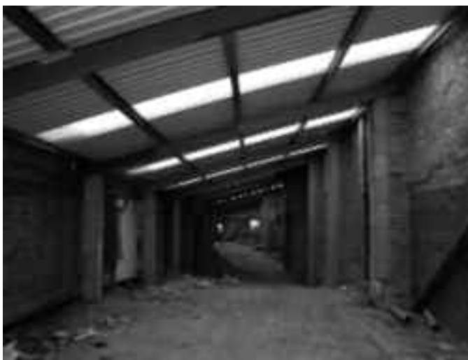
A la foto superior, espai que ocuparà la sala d'exposicions temporals. A l'esquerra, els futurs magatzems del Terracotta Museu.

trà, si s'escau, donar cabuda a una possible seu de l'Institut Tecnològic de la Ceràmica. Una sala d'exposicions temporals, una sala de projeccions i una cafeteria són els altres usos que rebran les naus que conformen l'equipament. La superfície a intervenir és de 2.272,40 m 2 .