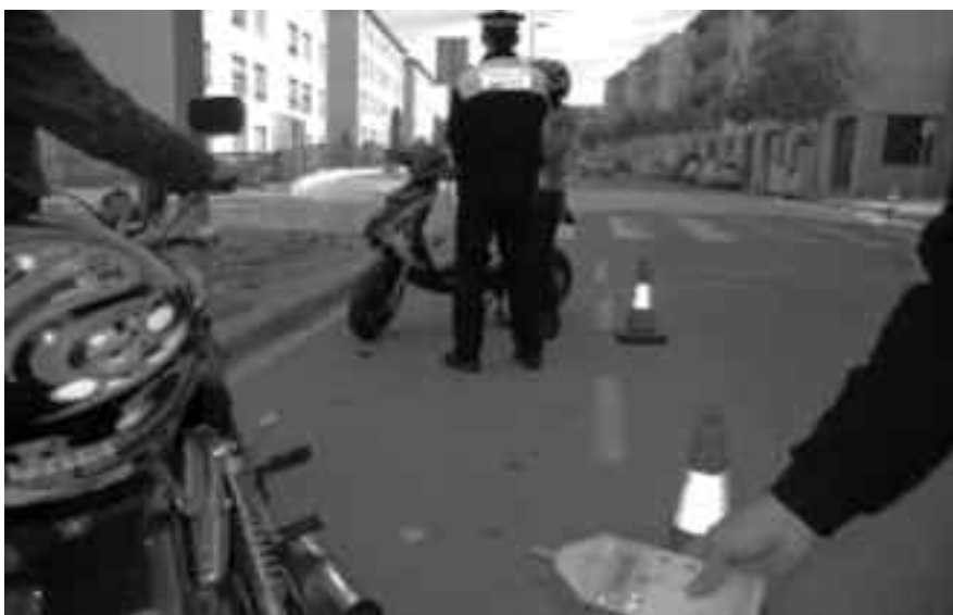
Dos agents de la Policia Local participen en un dels controls que s'han fet aquest mes.

En total, s'han fet 82 controls policials, s'han interposat 31 denúncies municipals (29 per sonometria i 2 per alcoholèmies positives) i 31 denúncies més derivades al Servei Català de Trànsit (5 per placa de matrícula no visible; 1 per ser un vehicle donat de baixa; 1 per conducció temerària; 3 per modificacions al motor; 14 per manca d'assegurança; 5 per manca de llicència de conducció; 1 per alcoholèmia positiva; i 1 per haver de passar ITV extraordinària). També