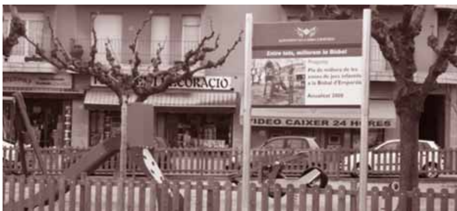
Parc infantil del carrer Coll i Vehí.

El passat 24 de febrer es va celebrar la Festa de l'arbre a la plaça Pau Casals, un espai que, gràcies a la contribució dels joves en la plantada d'arbres, va prenent