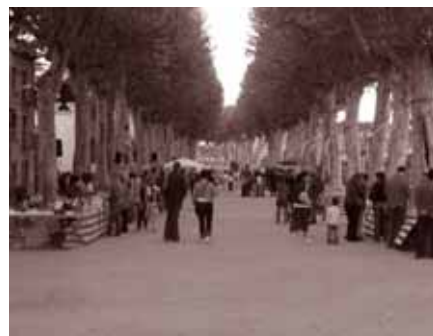
Sant Jordi al passeig.

En el marc del centenari del naixement de l'escriptora Mercè Rodoreda, s'han programat tres xerrades, un itinerari literari a Romanyà de la Selva i un lectura dramatitzada de textos l'autora. Aquestes activitats han estat organitzades per l'Àrea de Cultura i l'Oficina de Català.