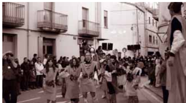
Els Escoltes a la rua de Carnestoltes.