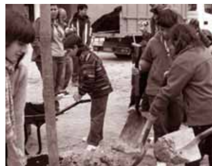
Festa de l'arbre.

forma. Juntament amb la plaça Narcís de Carreras i un solar municipal adjacent, la plaça resoldrà la connexió entre la Llar d'Infants i el centre de la Bisbal. La primera intervenció que s'ha fet a la plaça Pau Casals ha estat la pavimentació de les voreres i la plantada d'arbres. Es preveu que en una segona fase s'instal·li l'enllumenat i es finalitzi l'ordenació del recinte. La superfície resultant de l'ordenació de tot l'espai, format per les dues places i un solar, serà d'uns 1.600 m 2 per a l'ús públic.