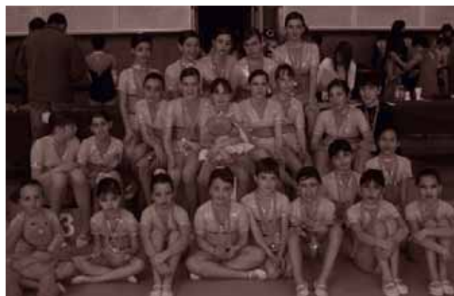
Campionat de gimnàstica rítmica.

Sovint, el Patronat d'Esports dona suport als diferents clubs i entitats de la Bisbal d'Empordà, que organitzen actes com: el Memorial Jordi Sabater, diada de l'Escola de Bàsquet (Club de Bàsquet); la Cursa Cames Ajudeu-me (Grup Esportiu Bisbalenc); el campionat social pretemporada (Club Ciclista la Bisbal), campionat comarcal de Tennis Taula (Club Tennis Taula), i la Marxa BTT Conca del Daró (Club Ciclista Daró). També som testimonis directes de la dinàmica activitat de l'esport a la Bisbal, dels clubs que la representen i dels bons resultats obtinguts, com el futbol bisbalenc, que ha fet història al MIC (Mediterranean International Football Cup) amb la seva victòria contra el club del Manchester United.