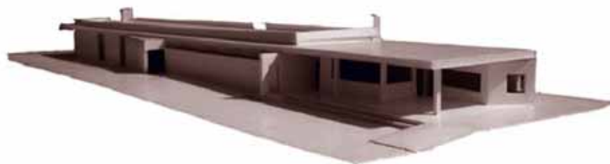
Maqueta dels nous vestuaris del camp de futbol.

A banda d'aquestes inversions, l'Ajuntament preveu cobrir totes les altres necessitats, com les millores en l'àmbit del microurbanisme que, amb un treball transversal de les diferents àrees, és un dels reptes pendents d'aquesta legislatura.