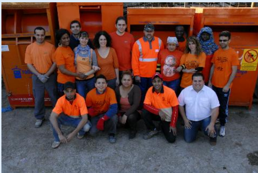
Grup de treballadors d'una de les plantes de triatge de Roba Amiga a Catalunya

Roba Amiga i totes les entitats i empreses que formen part de la xarxa per l'aprofitament d'aquest residu estem profundament agraïts per la vostra col·laboració.